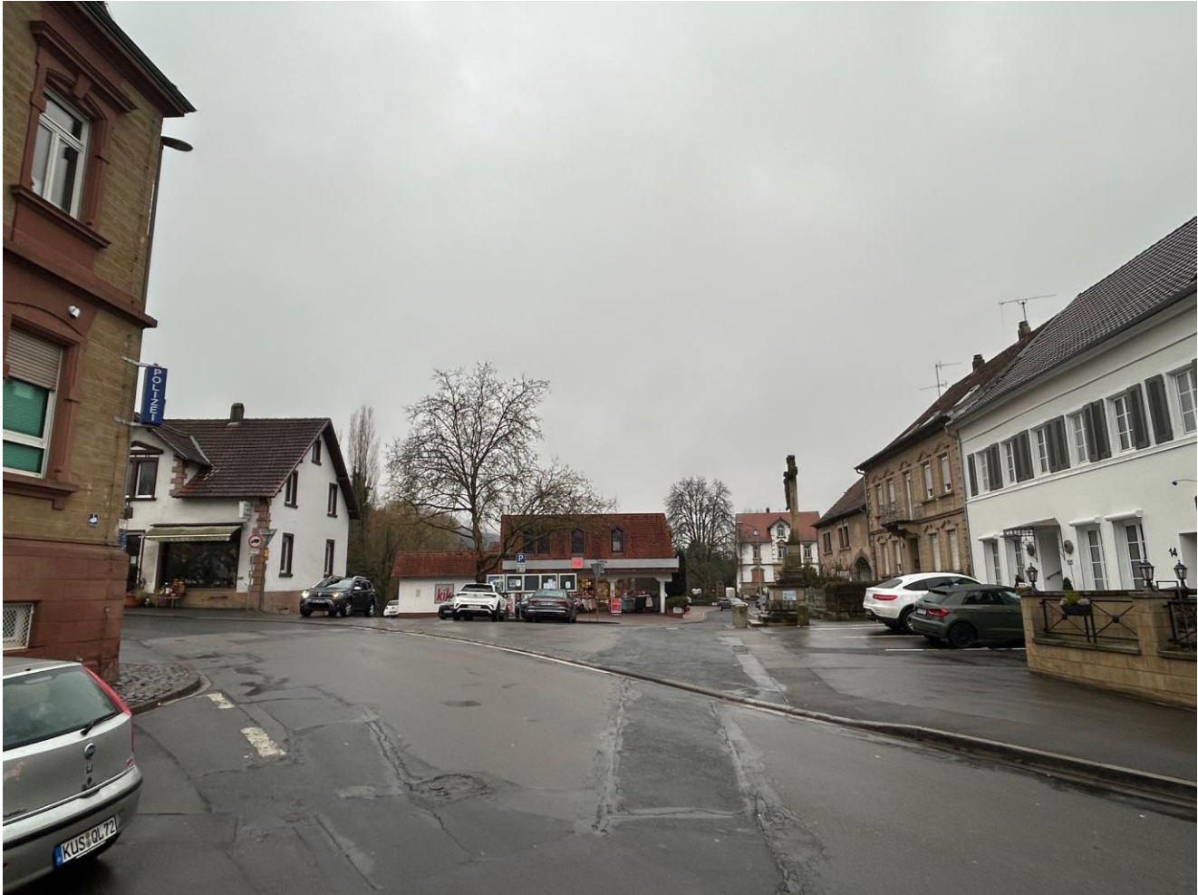
Blick auf dem Platz am Kreuz (Stand: Januar 2026)

Im Zuge des Projekts sollen auch die Einmündungen und Anschlüsse an die angrenzenden Straßenräume und Platzflächen Berücksichtigung finden. Hierbei ist auch der notwendige Schwerlastverkehr (Linien- und Schulbusse sowie LKW) über den Platz am Kreuz und zum Baumarkt am Friedhofweg zu berücksichtigen, u. a. bei der Ausgestaltung der Flächen und ihrer Qualitäten.